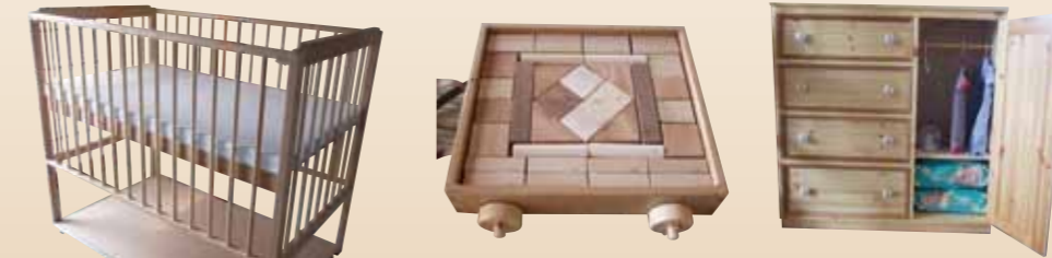
作品名 ベビーベッド&ベビーダンス&つみ木

長女の出産に合わせて作り ました。 ベッドに関しては娘の身長 に合わせて高くしました。 ベビーダンスに関しては、 あとから下段を追加できる ようにしました。