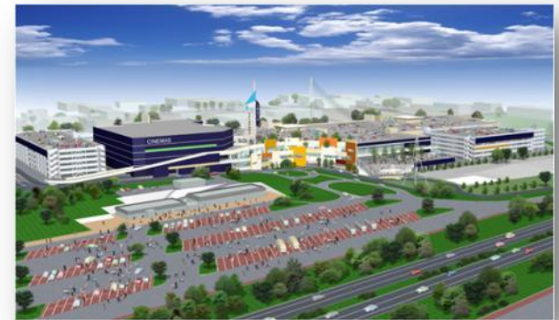
「ららぽーと磐田」完成予想図

静岡県磐田市「ららぽーと磐田」1Fに ホームファッション専門店「casa」と アウトドアショップ専門店「SWEN」が 複合店舗として誕生！