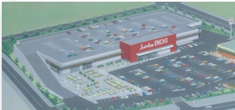
「ジャンボエンチョーきらりタウン浜北店」完成予想図