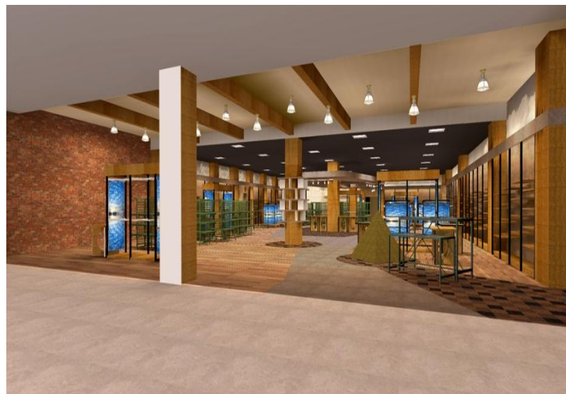
「SWENクロスガーデン富士中央店」完成予想図イメージ画像となります。

SWEN富士店が移転しSWENクロスガーデン 富士中央店として新しくスタートします。